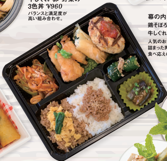
幕の内お弁当 鶏そぼろ ¥1,300 牛しぐれ ¥1,400 人気のおかずが 詰まった男性でも 食べ応えのあるお弁当。