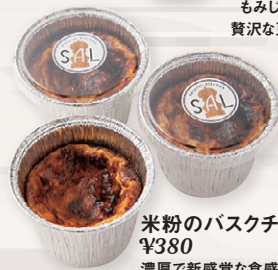
米粉のバスクチーズケーキ ¥380 濃厚で新感覚な食感です。

他にもお弁当や丼、お惣菜など、日替わりで揃っていますのでお気軽にお立ち寄りください。