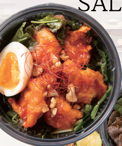
ヤンニョム丼 ¥960 ピリ辛コウマダレが 食欲をそそります。

手作り、素材、自家製にこだわった、安心で栄養も満点な料理の数々は お子様がいらっしゃるファミリーにも特におすすめです。