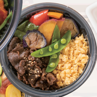
牛しぐれ・卵・野菜の 3色丼 ¥960 バランスと満足度が 高い組み合わせ。