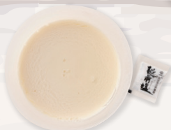
越前塩で食べる自家製豆腐 ¥220 当店人気の手作りのお豆腐です。