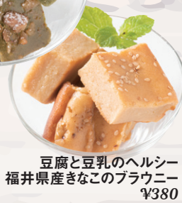
豆腐と豆乳のヘルシー 福井県産きなこのブラウニー ¥380 きなこも入った滑らかな口当たりのブラウニー。 お豆腐と豆乳でヘルシー。