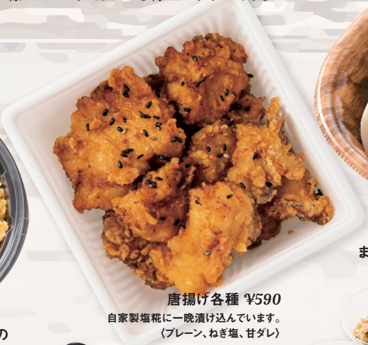
唐揚げ各種 ¥590 自家製塩粒に一晚漬けています。 (ブレン、ねぎ塩、甘ダレ)