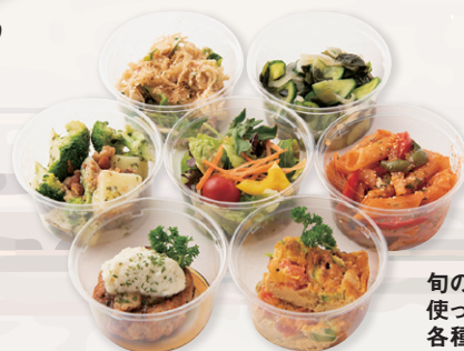
旬の素材を 使ったお惣菜 各種 各¥320~