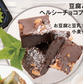
豆腐と豆乳の ヘルシーチョコブラウニー ¥380 お豆腐と豆乳でヘルシー。 小麦・乳不使用。