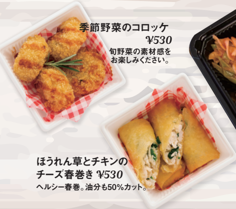
季節野菜のコロッケ ¥530 旬野菜の素材感を お楽しみください。