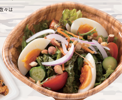
まこちゃん卵とローストナッツのサラダ ¥650 サラダメインの日にかがですか。越前塩付