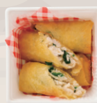
ほうれん草とチキンの チーズ春巻き ¥630