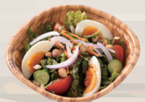
まごちゃん卵と ローストナッツのサラダ ¥650