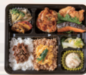
幕の内お弁当 ●鶏そぼろ ¥1,400 ●牛しぐれ ¥1,500