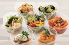
旬の素材を使った お惣菜 各種 ¥360~