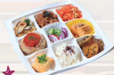
★SALプレート ※おかず9種盛りに対応可 ¥1,280