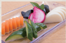
無農薬ぬか床で作った ぬか漬 ¥390

他にもお弁当や丼、お惣菜など、日替わりで揃っていますのでお気軽にお立ち寄りください。