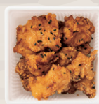
唐揚げ (ブレン/甘ダレ/ねぎ塩/親鶏) ¥650