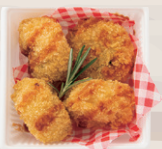
コロケ ●グラタンコロケ ¥630 ●季節の野菜コロケ ¥630