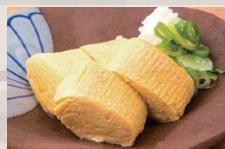
まごちゃんたまごの ふわふわだし巻き ¥650