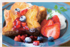
バンベルデュ フルーツ ●レギュラーサイズ ¥1,300 ●ハーフサイズ ¥690