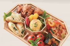
オードブル ●2~3人前 ¥2,850 ●4~5人前 ¥5,500