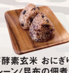
発芽酵素玄米 おにぎり1個 (ブレン/昆布の佃煮/ツナ ひじき/ゆかり/ワカメ) ¥250 ごはん(単品) ¥230