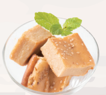
米粉と豆腐のブラウニー きな粉のブラウニー ¥400