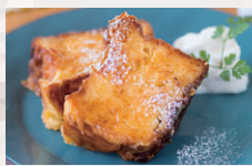
バンベルデュ ブレン ●レギュラーサイズ ¥1,080 ●ハーフサイズ ¥580