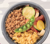
★鶏そぼろ・卵・野菜の3色丼 ¥890