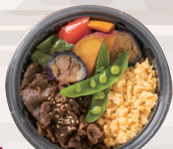
★牛しぐれ・野菜・卵の3色丼 ¥980