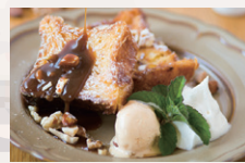
バンベルデュ キャラメルナッツ ●レギュラーサイズ ¥1,180 ●ハーフサイズ ¥630