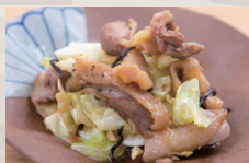
名古屋コーチンの こだわり塩炒め ¥790