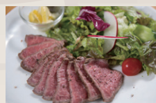
自家製塩レモンと越前塩で食べる 国産牛のローストビーフ ¥1,280