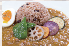
旬野菜のトマトチキンカレー ¥1,180