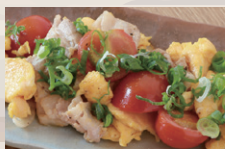
トマトと豚バラの たまご炒め ¥880