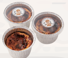
米粉のバスクチーズケーキ ¥400