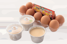
もみじたまごで作った 豆乳黒みつプリン ¥350