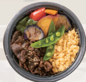
牛しぐれ・野菜・卵の3色丼