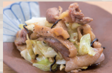
名古屋コーチンの こだわり塩炒め