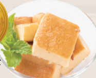
有機米粉の バイクドチーズケーキ ¥450