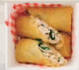
ほうれん草とチキンの チーズ春巻き