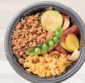
鶏そぼろ・卵・野菜の3色丼