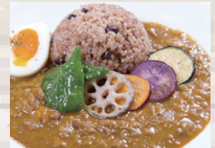
旬野菜のトマトチキンカレー