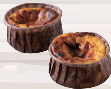
米粉のバスクチーズケーキ ¥400