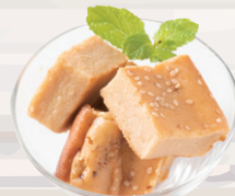
米粉と豆腐のブラウニー きな粉のブラウニー ¥400