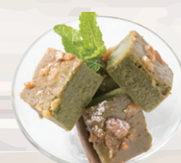
米粉と豆腐のブラウニー 抹茶ブラウニー ¥400