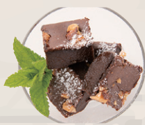
米粉と豆腐のブラウニー チョコブラウニー ¥400