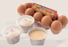
もみじたまごで作った 豆乳黒みつプリン ¥400