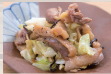
名古屋コーチンの こだわり塩炒め