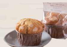
米粉の塩麹マフィン ¥380