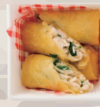
ほうれん草とチキンの チーズ春巻き